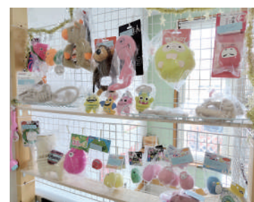
ワンちゃん用おもちゃや、無添加のクッキー、ポークジャーキーなど手作りのおやつも販売しています