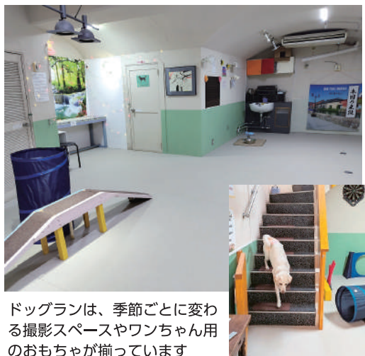
ドッグランは、季節ごとに変わる撮影スペースやワンちゃん用のおもちゃが揃っています