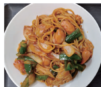
人気メニュー「ナポリタン」と「油淋鶏定食」。どちらもボリュームたっぷり、特にナポリタンは男性のお客様の注文率が高いメニューです。