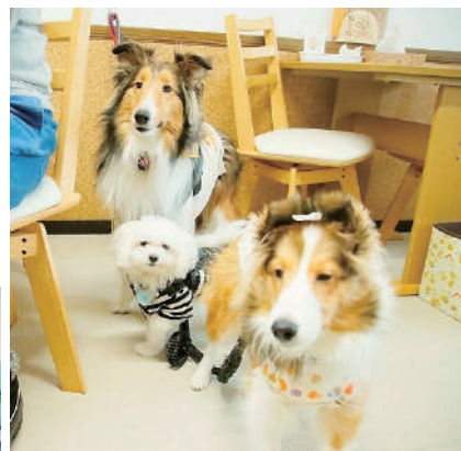
カフェスペースでは、ワンちゃんと一緒に食事を楽しむことができます。飼い主との食事を心待ちにしているようです