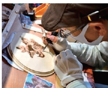
ウッドバーニング商品は、飼い主の想いを聞いて、丹精を込めて一枚一枚手作りして仕上げています