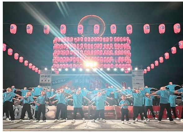
イベント参加時は、毎年カラーを変え、全員お揃いのポロシャツ(2024年はブルー)で踊っています