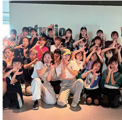
イベントなど活動の場が戻ってきて、ダンスレッスンも多くの生徒が参加しています