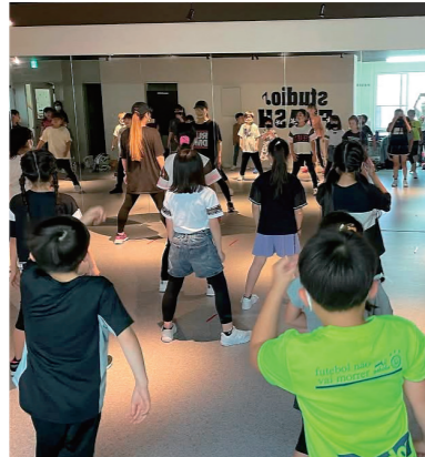
鏡で自分の動きを確認しながらレッスン。ダンスの楽しさや自分らしさを発揮できるよアドバイス等を行っています