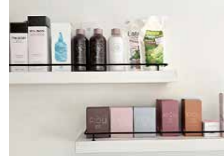
使い心地や仕上がりにこだわったMILBON (ミルボン)、PJOLI (プジョリ) などのヘアケア商品も販売しています。