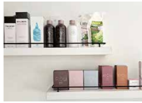
使い心地や仕上がりにこだわったMILBON (ミルボン)、PJOLI (プジョリ)などのヘアケア商品も販売しています。

「当店が縮毛矯正に特化している美容室であることはあまり知られていないので、情報発信を強化してより多くの人にお店を知っていただき、癖毛や縮れ毛などで髪のコンプレックスを感じている方の悩みを解消してあげたいと思っています。当店で縮毛矯正をされたお客様は、まわりからすごく綺麗な髪だねと褒められることが多く、当店の自慢です。」