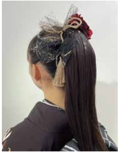
成人式や結婚式、着物などシーンに合わせたお客様に好評のヘアセット