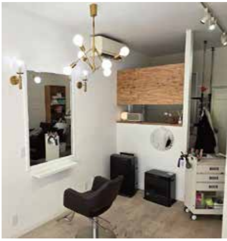
お客様に投票で選んでいただいた照明器具を設置した店内