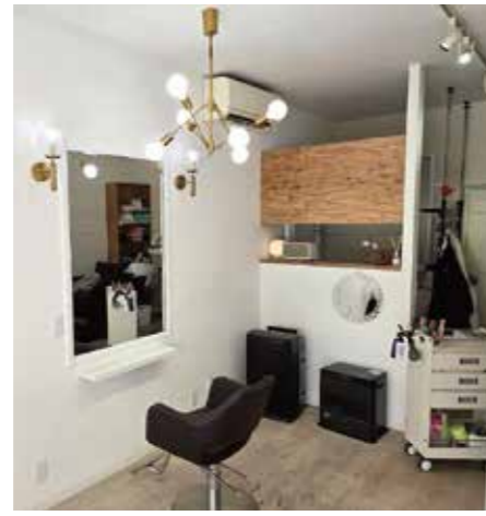
お客様に投票で選んでいただいた照明器具を設置した店内