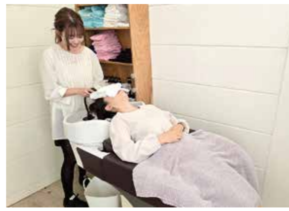
快適な座り心地のシャンプー台を導入しています