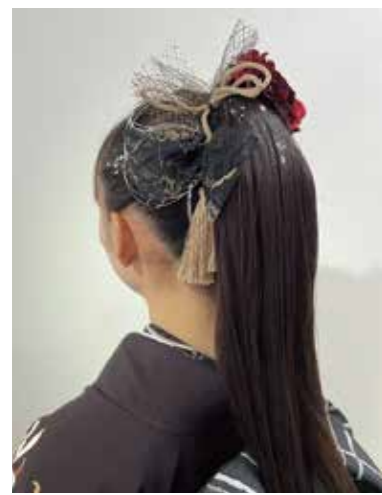
成人式や結婚式、着物などシーンに合わせたお客様に好評のヘアセット