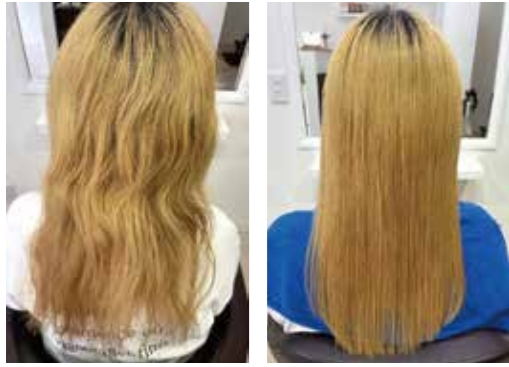
before after ブリーチの縮毛矯正もできることが強みです