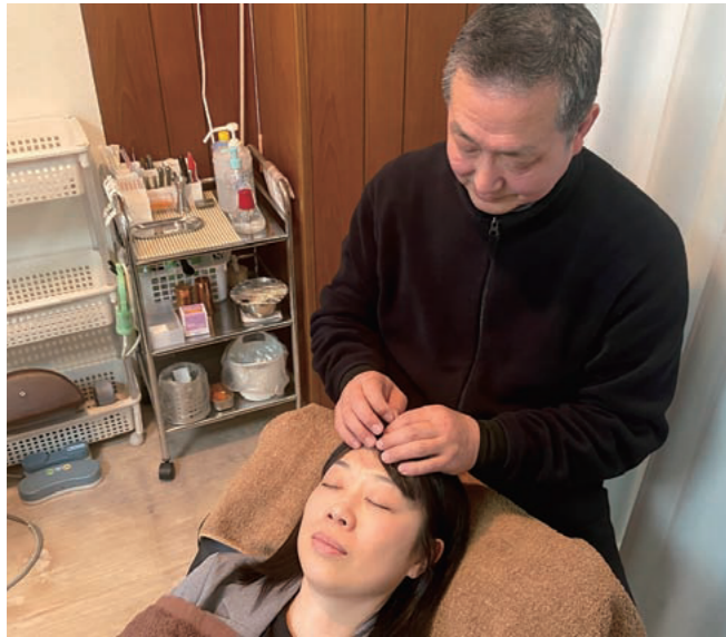
女性に好評の美容鍼灸(施術時間約40分、3,300円)