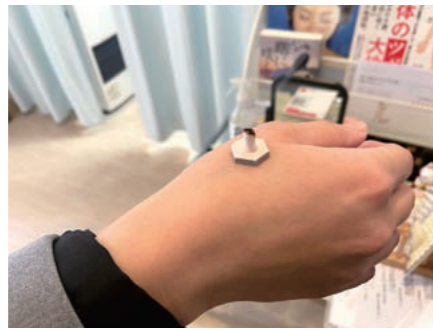
お灸はツボを温めて刺激することで症状の緩和、血流改善などの効果が期待できます