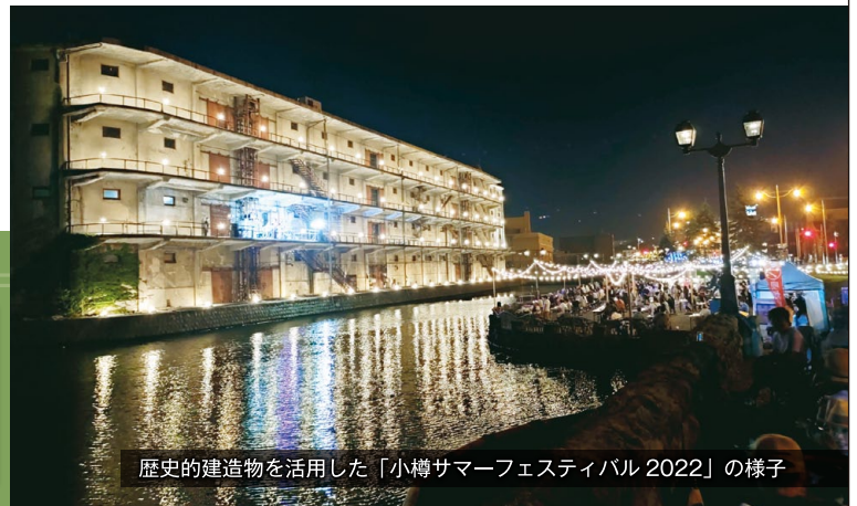
歴史的建造物を活用した「小樽サマーフェスティバル 2022」の様子