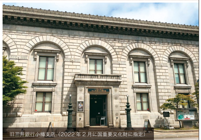
旧三井銀行小樽支店 (2022年2月に国重要文化財に指定)

日本遺産候補地域「北海道の『心臓』と呼ばれたまち・小樽」のストーリー及び構成文化財等をモチーフにした新たな商品を開発するメンバーを募集します。メンバーは、小樽の日本遺産や商品開発についての講演を受けた後に、グループに分かれてワークショップを行います。多くのアイデアの中からコレ!というものを選んで、グループ毎に商品開発に向けて、議論・討論を進め、11月には商品の販売、もしくは試供品の提供を行うことを目指します。