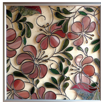
グラスアート ステンドグラスのような作品を簡単に作ることが出来るクラフトです。