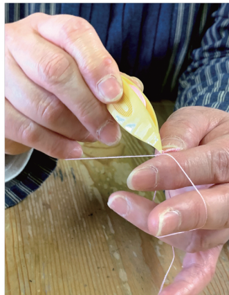
タンディングレース 舟形の小さな糸巻きに巻いた糸を指で結び目を作っていくレースの技法です。