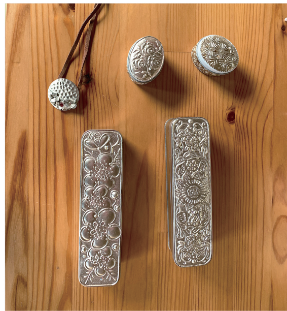
メタルエンボッシングアート ロシア・ヨーロッパで何世紀も前から職人たちによって伝承された技術を現代的にアート化したクラフトです。