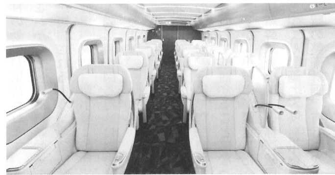
グランクラスシート